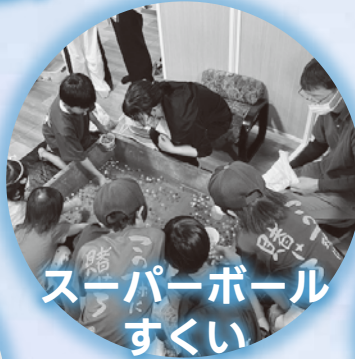
スーパーボール すくい