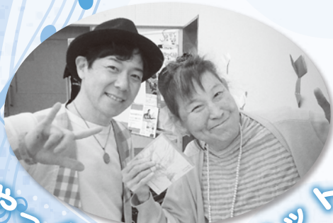
やっくんとツーショット