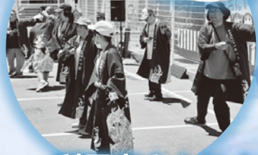
利用者さんによる 福の山音頭披露