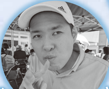
おまつり楽しいね!