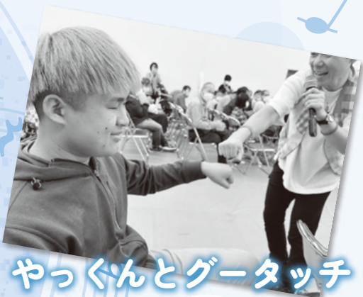
やっくんとグータッチ