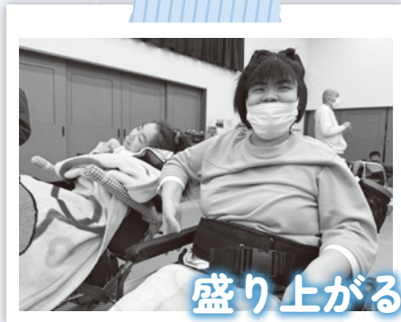
盛り上がる参加者の様子