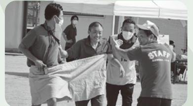
満面の笑みでゴール