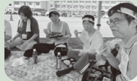
お弁当おいしいな