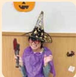
トリックオアトリート!

ゲームのあとはジュースと一緒にお菓子を味わい、楽しいひとときを過ごしました。終了後には「楽しかった!」「お菓子ありがとう!」といった声もたくさん聞かれ、季節を感じられる行事を子どもたちと一緒に楽しめたことを、職員一同とても嬉しく思っています。何より、子どもたちの笑顔がたくさん見られたことが一番の喜びでした。