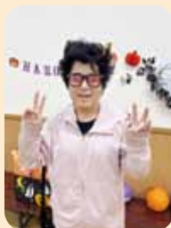
仮装をしてハイチーズ! 何があるかな?