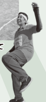
ダンシング 玉入れ