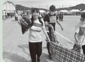
ボールを落とさないように