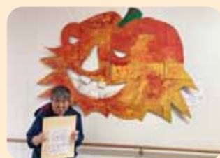
描いた絵が選ばれたよ