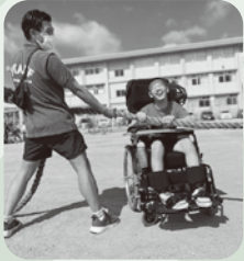
力を合わせて綱引き

競技中には「頑張れー!」という声援や、拍手で互いの健闘を称え合う場面が多く見られ、会場全体が温かい雰囲気になりました。利用者さんからは「楽しかった」「疲れたけどいい思い出になった」といった声が聞かれ、準備に携わった職員一同、大変嬉しく思っています。これからも、笑顔あふれる交流の場を大切にしていきたいと思います。