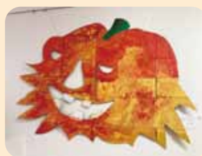
みんなで色を塗ったよ