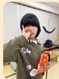
上手にお菓子とれたよ!!