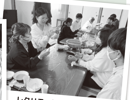
レクリエーションの様子②