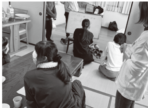
レクリエーションの様子①