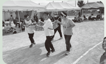
みんなで力を合わせて