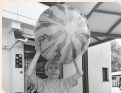
夏を楽しみました。