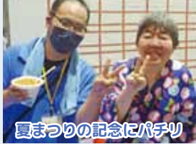
夏まつりの記念にパチリ