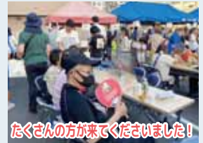
たくさんの方が来てくれました！