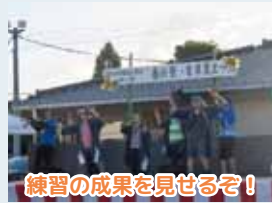
練習の成果を見せるぞ!

7月26日（土）に、春日寮・青葉夏まつりを開催しました。今回の春日寮・青葉夏まつりでは模擬店に加えステージや、利用者さんが中心となって運営をしたゲームコーナー、6月より再オープンしたショップ「en.」内でのバザー等、皆さんに楽しんでいただけるよう企画運営を行いました。利用者さんからは「焼きそば美味しかった」「ゲームコーナーに人がいっぱい来てくれたよ」と、笑顔がたくさん見られ、大盛況の夏まつりとなりました。