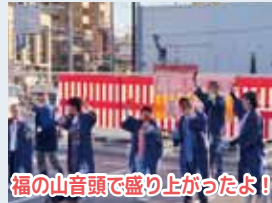
福の山音頭で盛り上がったよ！