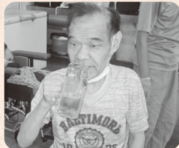
美味しそうに吞まれてます！