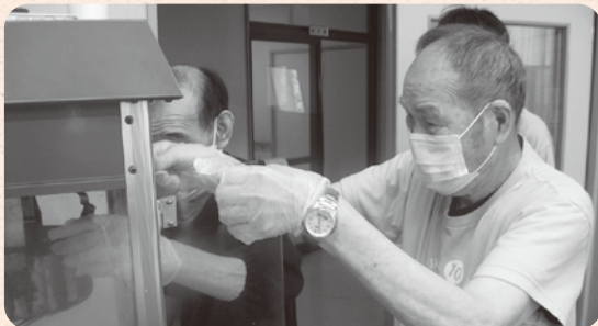
まるでプロみたい