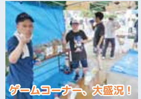
ゲームコーナー、大盛況!