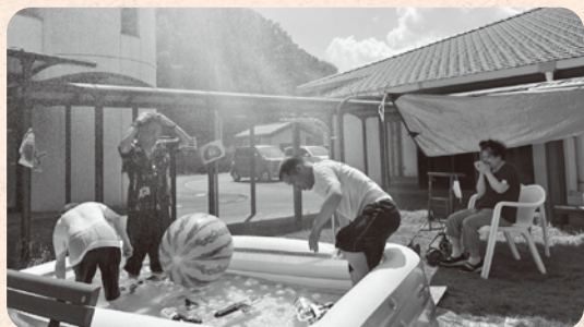
プールの季節です！