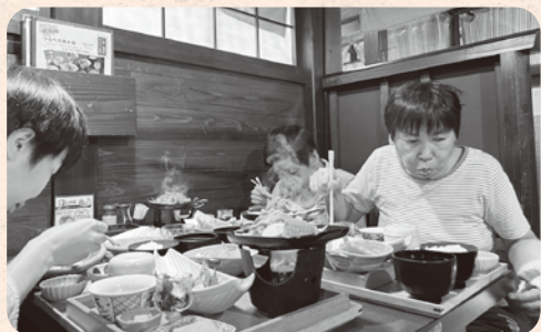
どれから食べようかな