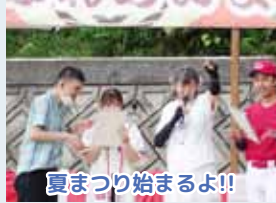
夏まつり始まるよ!!