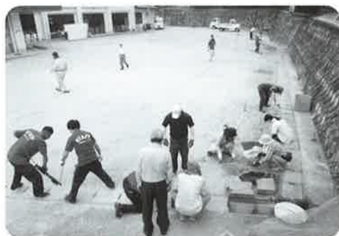
(せんだんの家 岡山恵美)

私は、この言葉を聞いて、この1日のAさんを見ていて、今回Aさんを作業に誘って良かったと思いました。普段は、自分の意思を相手に伝える事を恥ずかしがってしまい、「わからない。恥ずかしい。」と言うことが多くありましたが、今回はそういったことが少なく、何事も自分から進んで行う事ができていました。また、この日を境に、Aさんはより一層、作業参加に前向きになりました。Aさんと一緒に作業をして8ヶ月ほどになりますが、作業能力はもちろん、様々な面の成長を見ることができ、今現在では、週1日の参加から週3日の作業に取り組むことができるようになりました。きっとAさんは今後、もっともっと成長されると楽しみにしています。