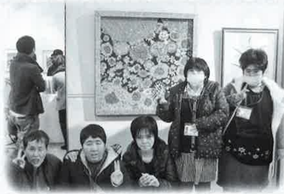
セレモニーに参加しました